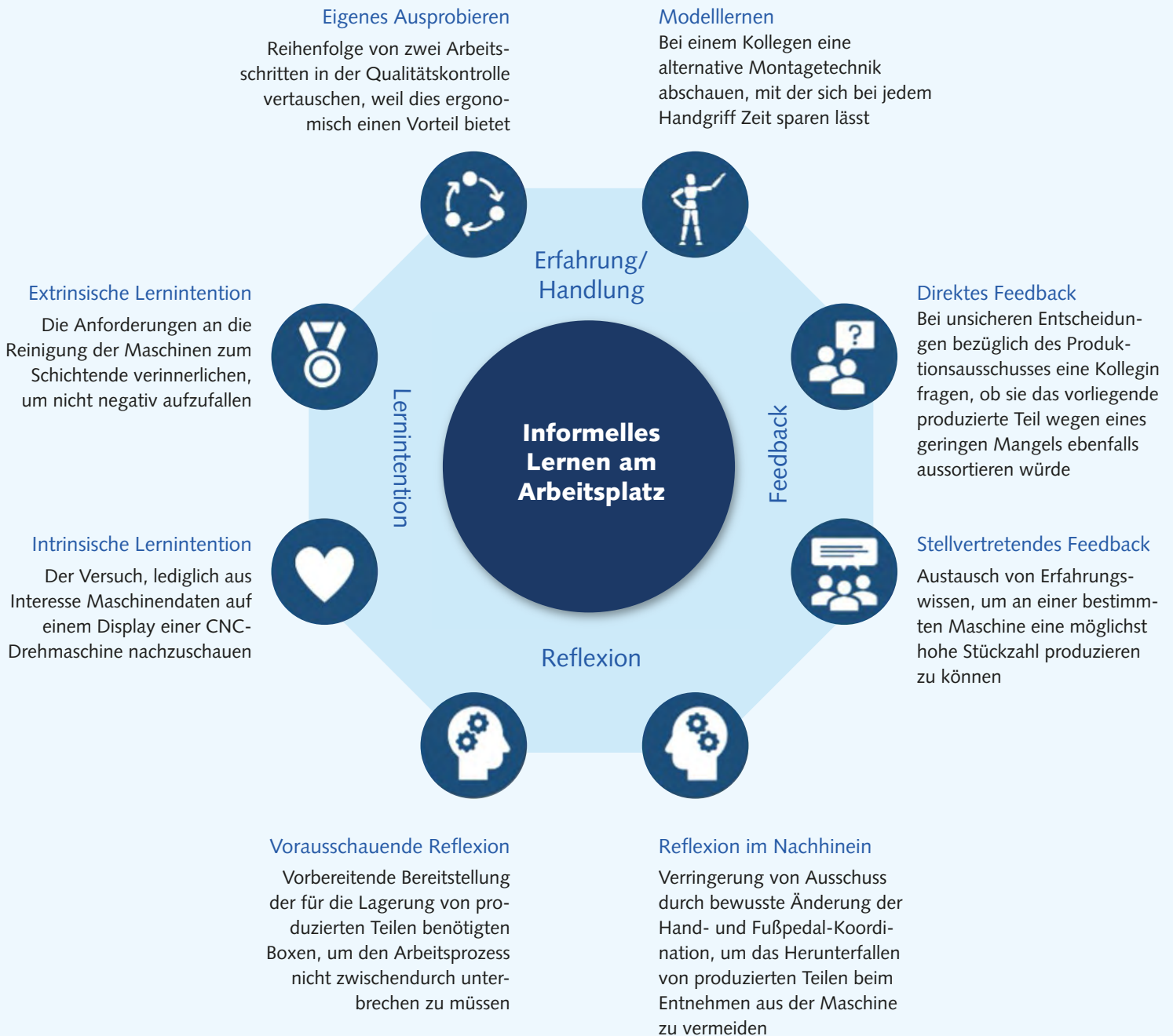
Abb. 1: Oktagon-Modell des informellen Lernens am Arbeitsplatz (in Anlehnung an Decius, Schaper & Seifert, 2019, S. 502) mit Beispielen für informelles Lernen bei einer industriellen Tätigkeit (in Anlehnung an Decius & Schaper, 2021a, S. 25)